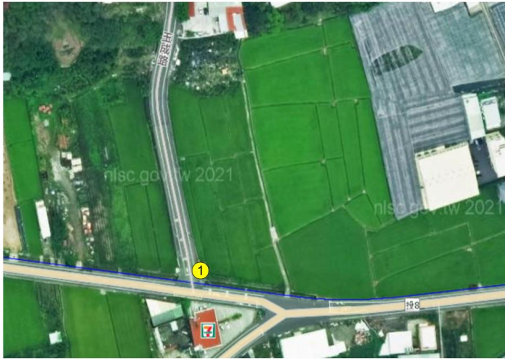
1. 南投縣草屯鎮御史里登輝路558號附近農田