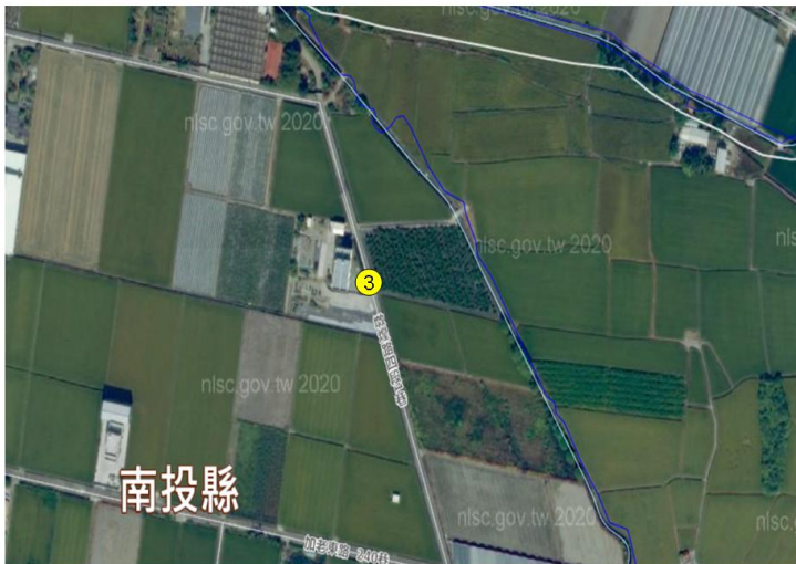
3. 南投縣草屯鎮加老里熾煌路四段一巷115號附近農田