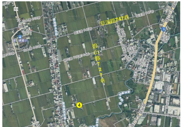
4. 南投縣草屯鎮復興里復興路186之29號附近農田